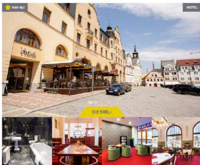
Hotel U Beránka Náchod