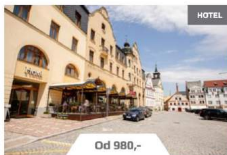
Hotel U Beránka Náchod

Pokud máte zájem o tuto formu prezentace vyplňte jednoduchý formulář.