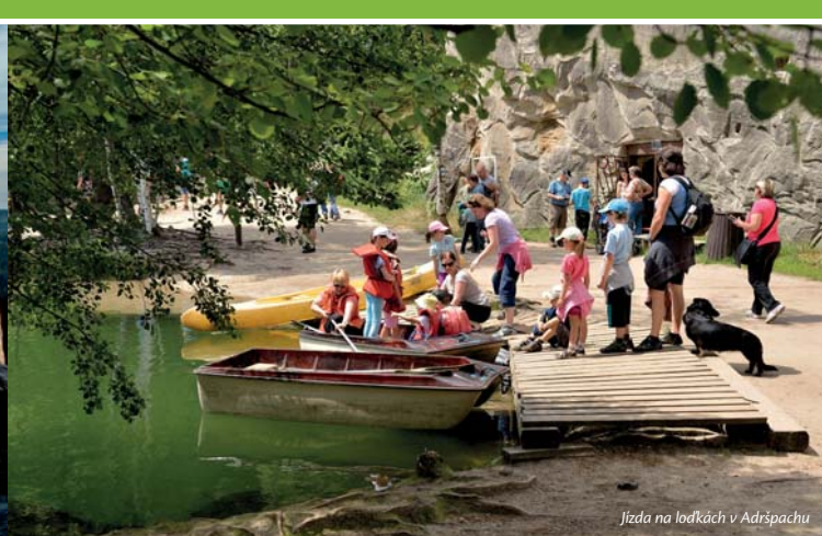
Jízda na loďkách v Adršpachu