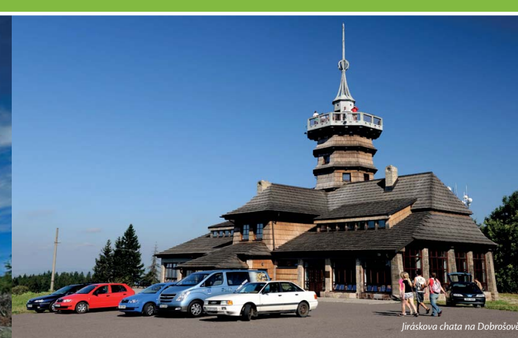
Jiráskova chata na Dobrošově