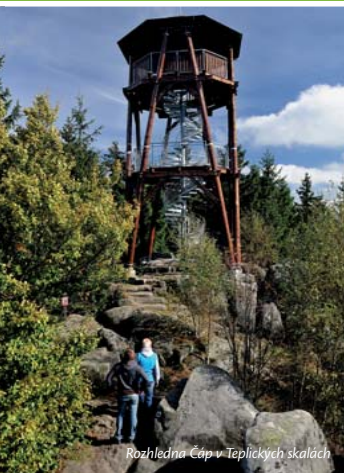
Rozhledna Čáp v Teplických skalách