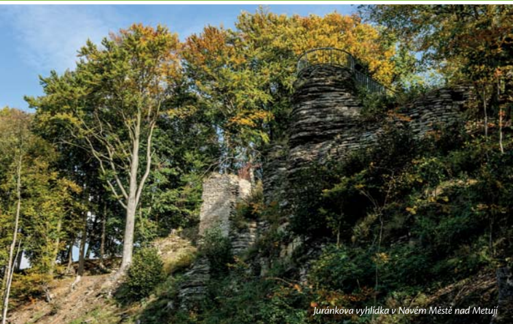
Juránková vyhlídka v Novém Městě nad Metují