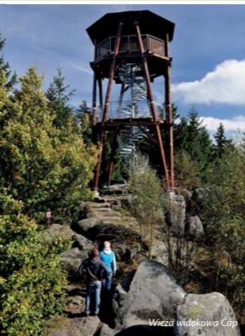
Wieża widokowa Čáp