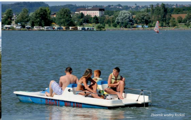
Zbiornik wodny Rozkoš