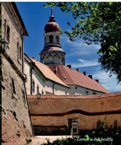
Zamek w Nachodzie