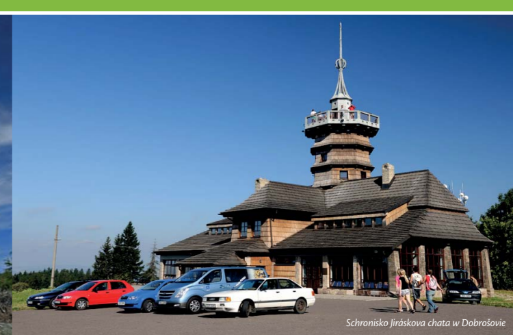
Schronisko Jiráskova chata w Dobrošovie