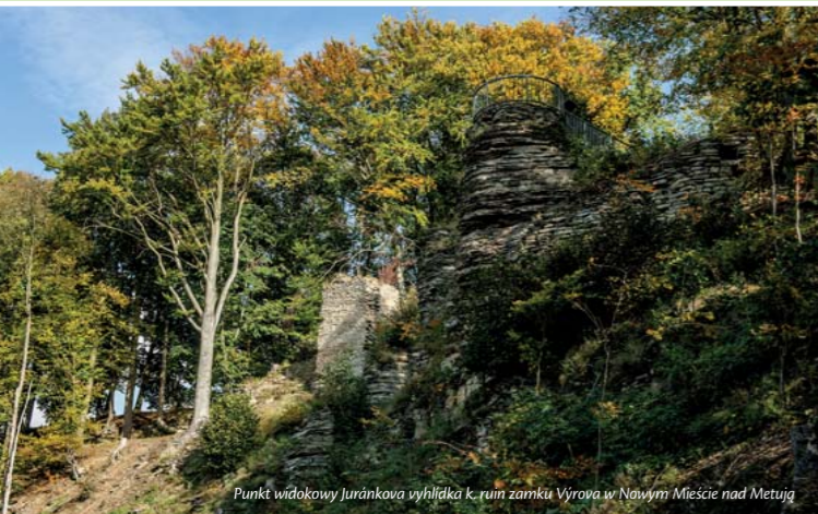
Punkt widokowy Juránkova vyhlídka k. ruin zamku Várova w Nowym Mieście nad Metują