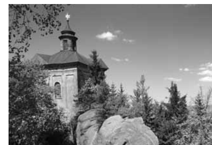
Kaple Hvězda v Broumovských stěnách

původní podobu a znovu a znovu vtahují své návštěvníky do příběhu Barunky Pančkové. Atraktivitu tohoto kraje pro turisty umocňuje přehradní nádrž Rozkoš u České Skalice, která se pyšní pojmenováním Východočeské moře a po jejíž hrázi se snadno dostaneme do Nového Města nad Metují, které nám kromě řady renesančních skvostů nabízí i červnový festival televizní a filmové komedie “Novoměstský hrnc smíchu”. Nedaleká Jaroměř doplňuje turistickou nabídku o pevnosti z doby císaře Josefa II. a Náchod zase o renesanční zámek a soubor pevností na Dobrošově, které měly chránit naši zemi během druhé světové války.