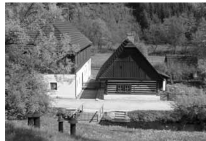
Staré bělidlo v Ratibořicích

Kde jinde než v kraji, který je z jedné strany ohraničen Krkonošemi a jejich podhůřím, z druhé strany pak Orlickem a Podorlickem, by mohly vzniknout ty největší klenoty naší literatury, ovlivněné navíc způsobem života v sousedním polském příhraničí a horním Polabí.