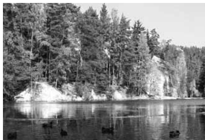
Pískovna u Adršpašských skal

Vítejte v Kladském pomezí, krajíně plné zajímavých příběhů. Na každém místě tu na vás dýchne atmosféra tolik známá z knih našich významných spisovatelů. Kladské pomezí má to privilegium být rodištěm hned několika předních českých literátů a s jejich jmény je spojováno dodnes.