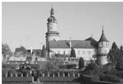
Novoměstský zámek s parkem

Je těžké říci, zda si Božena Němcová při psaní svého románu Babička uvědomovala, jak známou a slavnou se díky jejímu dílu stane krajina kolem České Skalice a Ratibořic, ale jistě by byla mile překvapena, kdyby viděla tento kraj dnes. Ratibořický zámek, Babiččino údolí, Staré bělidlo si zachovávají svou