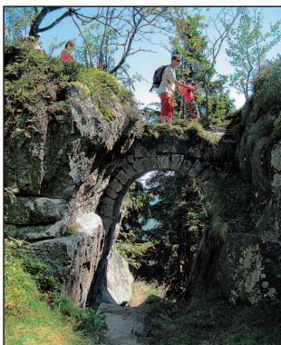
Fort Karola, zbytky pevnosti

Błędne Skały – skalní bludiště, labyrint rozsedlin mezi mohutnými bloky skal