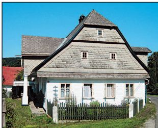
Bývala evangelická fara v Machovské Lhotě

Machovská Lhota – bývalá roubená evangelická fara z románu Aloise Jiráska „U nás“, roubené chalupy