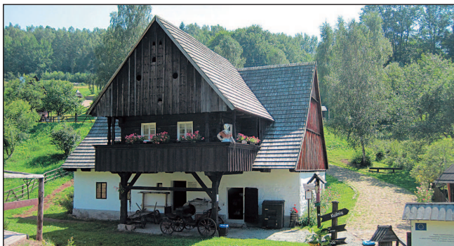
Skanzen lidové architektury v Pstrážnej

Pstrážna – malá osada, muzeum lidové architektury