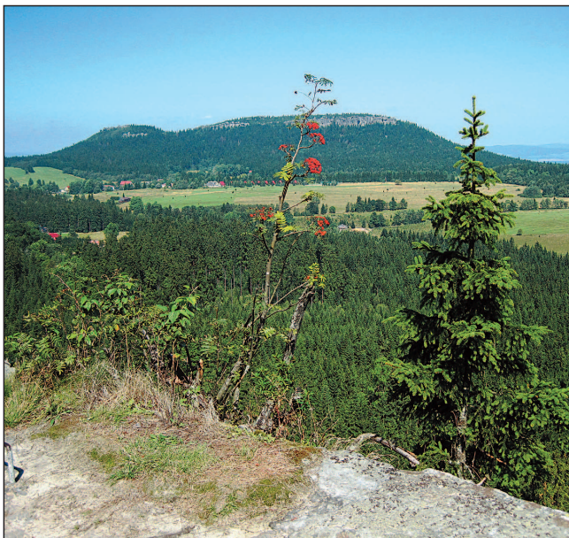
Sczeliniec Wiełki a pod ním osada Karlów

Karlów – turistická osada v srdci NP Stolové hory, základna k pěším výstupům na Sczeliniec Wiełki (Hejšovina 919 m n. m.)